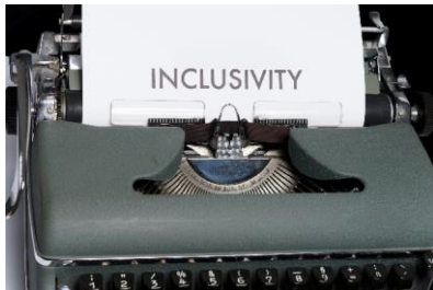
Figura 7. A inclusão social é mais do que simplesmente um slogan.