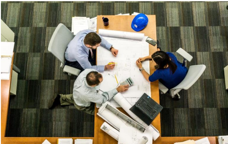
Figura 8. Atua como um multiplicador nos teus ambientes privados e profissionais.