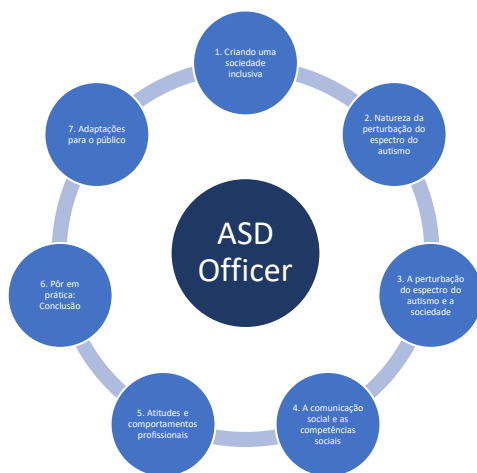
Figura 3. Estrutura do curso de formação “Mediador para a PEA” – apresentação simplificada (figura própria).

Para os participantes, é imprescindível participar em todos os módulos. Como mostra a Figura 3, todos os módulos estão interligados e todos juntos irão potenciar o conhecimento, a experiência, a reflexão e as competências na PEA a partir de uma perspetiva humana, positiva, ecológica e inclusiva.