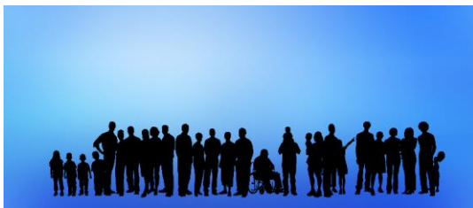
Figura 4. Uma sociedade inclusiva.