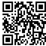
Figura 2. QR-Code da Plataforma AuTrain.

https://www.autrain.eu/autrain-platform/