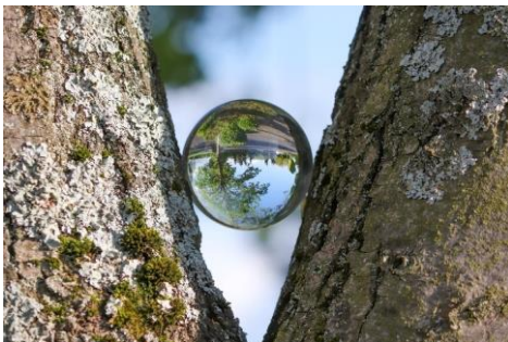
Figura 5. Percepções de um "mundo" estranho.