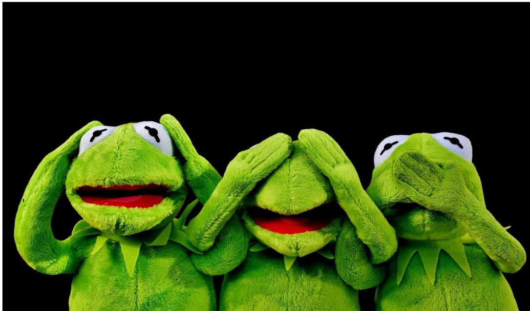
Εικόνα 6. Σίγουρα λάθος τρόποι επικοινωνίας.