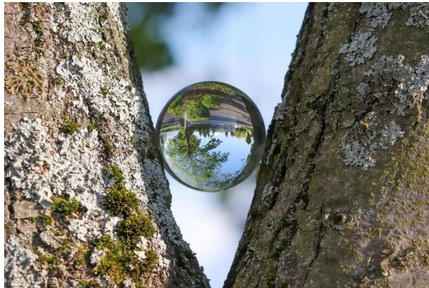
Εικόνα 5. Μια ματιά σε έναν περίεργο «κόσμο».