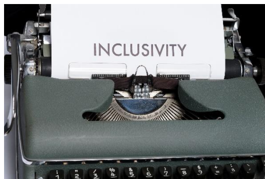
Εικόνα 7. Η κοινωνική συμπερίληψη είναι κάτι περισσότερο από μια απλή φράση.

Βίντεο: «CBS-Sunday Morning – Πρόσληψη αυτιστικών εργαζομένων»