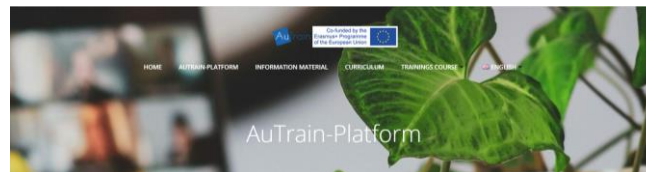
Εικόνα 1. Αρχική σελίδα – Πλατφόρμα „AuTrain“ ( www.austrain.eu ).

Για το σκοπό αυτό, έχει αναπτυχθεί μια διαδικτυακή πλατφόρμα η οποία αρχικά παρουσιάζει γενικές πληροφορίες για τις ΔΑΦ. Δεύτερον, η πλατφόρμα περιέχει όλο το απαραίτητο διδακτικό και εκπαιδευτικό υλικό που είναι απαραίτητο για το εκπαιδευτικό πρόγραμμα «Σύμβουλος ΔΑΦ» το οποίο έχει πιστοποιηθεί κατά ISO 17024 από εξωτερικό φορέα διαπίστευσης.