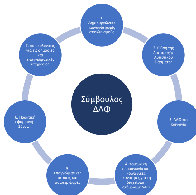
Εικόνα 3. Δομή του εκπαιδευτικού σεμιναρίου «Σύμβουλος ΔΑΦ» – απλοποιημένη παρουσίαση.

Για τις παρουσίες είναι απαραίτητο να λάβετε μέρος σε κάθε ενότητα. Όπως δείχνει η Εικόνα 3, όλες οι ενότητες συνδέονται και μαζί θα ενισχύσουν τη γνώση, την εμπειρία, τον προβληματισμό και τις ικανότητες στη ΔΑΦ από ανθρωπιστική, θετική, οικολογική και χωρίς περιορισμούς οπτική.